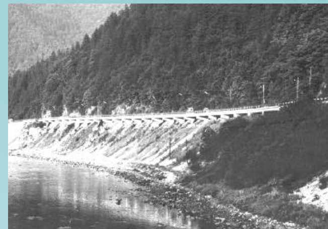
Galéria pod Strečnom