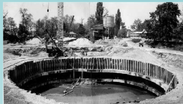
Stavebná jama kotevného bloku mosta SNP