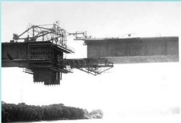
Debníacie vozíky na moste Lafranconi