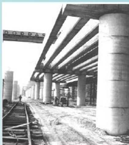
Diaľničné premostenie pri Morave