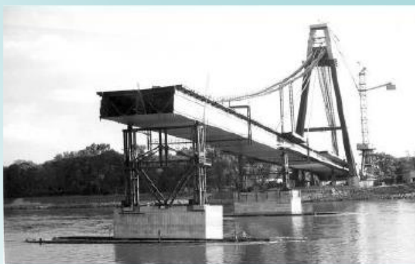
Naplavované dočasné podpery mosta SNP